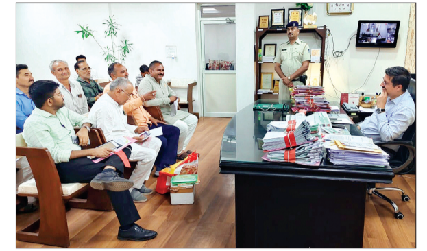
देवास। प्रतिनिधि मंडल ने कलेक्टर से मिलकर की चर्चा।