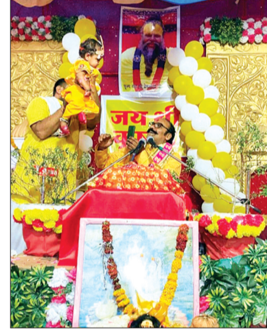
उत्सव मनाया। महाराज श्री ने आगे कहा कि भाद्रपद कृष्ण अष्टमी तिथि की घनघोर अंधेरी आधी रात को रोहिणी नक्षत्र में मथुरा के कारागार